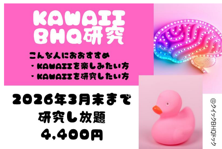
図 2：個人向け「Kawaii BHQ 研究」について

本受賞を記念し、これまで企業向けに展開してきた「Kawaii BHQ」の研究・実証の場を、個人のお客様向けにも拡大いたします。BHQ 社の公式ホームページにて、手軽な形態でご参加いただける「Kawaii BHQ 研究」プランの提供を予定しています。これにより、ご自身の脳の健康状態（BHQ）をチェックしながら、Kawaii がもたらすポジティブな効果を科学的に体感いただくことが可能になります。