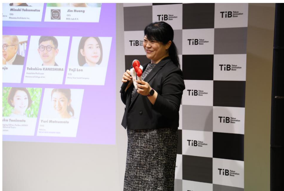
図 1：WE AT CHALLENGE 2025 受賞の様子

Kawaii を通じた市民科学 BHQ（脳の健康）研究を構想し、脳科学を専門にしない方であっても、みんなでなかよく研究を進める Kawaii BHQ 研究では、これまでビジネスパーソン脳の健康向上に取り組んでまいりました。本受賞を記念し、より多くの方にご参加いただくため、これまで企業向けに展開してきた研究・実証の場を、個人のお客様向けにも拡大する「Kawaii BHQ 研究」個人プランの提供を開始いたします。