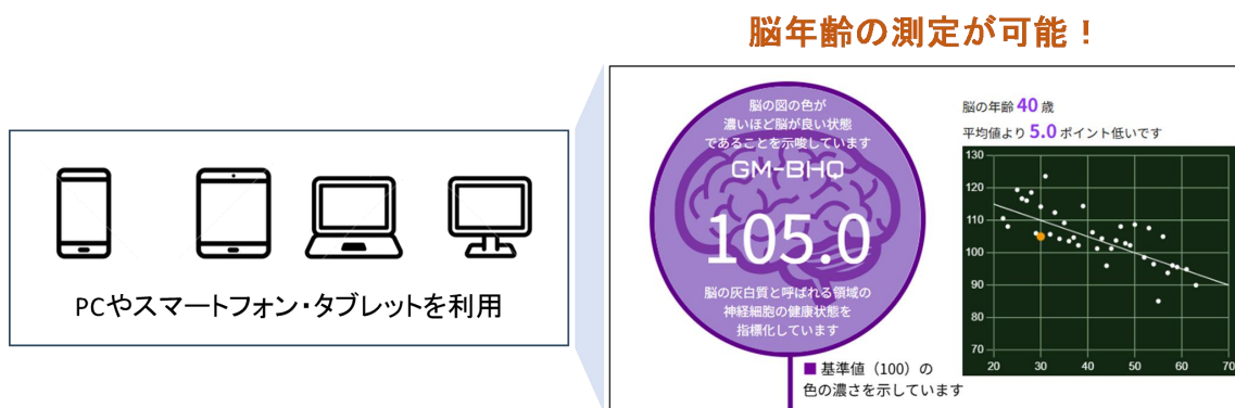
図1 『クイック BHQ ドック』サービス

BHQは本来MRI測定による脳画像データから算出される指標ですが、2023年に開発した顔映像からBHQを推定する「推定BHQ」計測器をWEBアプリ化することにより、どこでも、誰でもが手軽に計測できるようになりました。企業における健康経営の必要性が叫ばれる中、『クイック BHQ ドック』サービスによって、従業員のウェルビーイングをサポートしていく予定です。